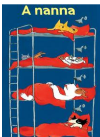
A nanna Dorothee de Monfreid, Babalibri, 2016

Otto cagnolini in una stanza, due letti a castello e Popov russa come una segheria. Miki è sveglio e si annoia, che si fa?