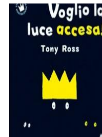
Voglio la luce accesa Tony Ross, Lapis, 2014

Orsetto regala ai suoi amici topini, Titta e Meo un pesciolino. Decidono di chiamarlo Rosso. Ben presto si accorgono che il loro amico non chiude mai occhio, né di notte né di giorno.