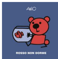
Rosso non dorme Attilio, Lapis, 2018

Immaginate di svegliarvi in mezzo alla notte con un mostro nel vostro letto. È terrificante, ma può avere un risvolto inaspettato.