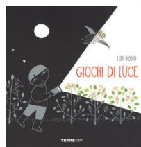
Giochi di luce Lizi Boyd Terre di mezzo, 2017

Il bambino Pietro, che si aggira in una foresta nel mezzo della notte, è spaventato dai successivi predatori che osserva di nascosto, uno più terribile dell'altro, finché incontra un coniglio che gli propone una via d'uscita...!