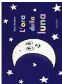
L'ora della luna Alex Sanders Babalibri, 2017

Otto cagnolini in una stanza, due letti a castello e Popov russa come una segheria. Miki è sveglio e si annoia, che si fa?