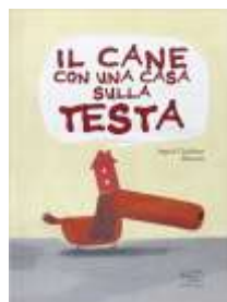
Il cane con una casa sulla testa Ingrid Chabbert Barroux, Clichy, 2016

Una storia tenerissima che si sviluppa su più piani narrativi, una storia di amicizia che lancia un messaggio delicato: si può accettare anche chi è diverso da noi, chi parla un'altra lingua, chi ci sembra strano e lontano dai nostri costumi.