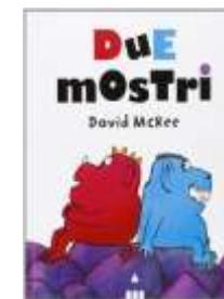
Due mostri David McKee, Lapis, 2014

Due mostri divisi da una montagna si parlano attraverso un buco: è così che finiscono per litigare, ma anche per abbattere la barriera che li separa.