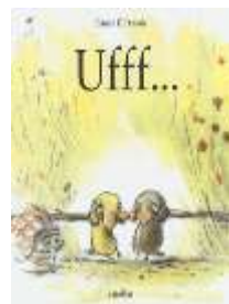
Ufff... Claude K. Dubois, Babalibri, 2017

Una storia tenerissima che si sviluppa su più piani narrativi, una storia di amicizia che lancia un messaggio delicato: si può accettare anche chi è diverso da noi, chi parla un'altra lingua, chi ci sembra strano e lontano dai nostri costumi.