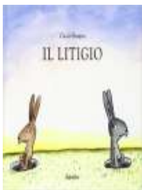
Il litigio Claude Boujon, Babalibri, 2009