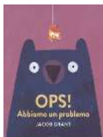
Ops! : abbiamo un problema Jacob Grant Lapis, 2018