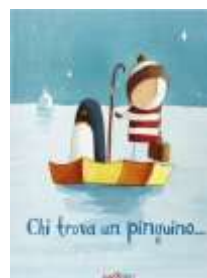
Chi trova un pinguino... Oliver Jeffers Zoolibri, 2013

Due mostri divisi da una montagna si parlano attraverso un buco: è così che finiscono per litigare, ma anche per abbattere la barriera che li separa.